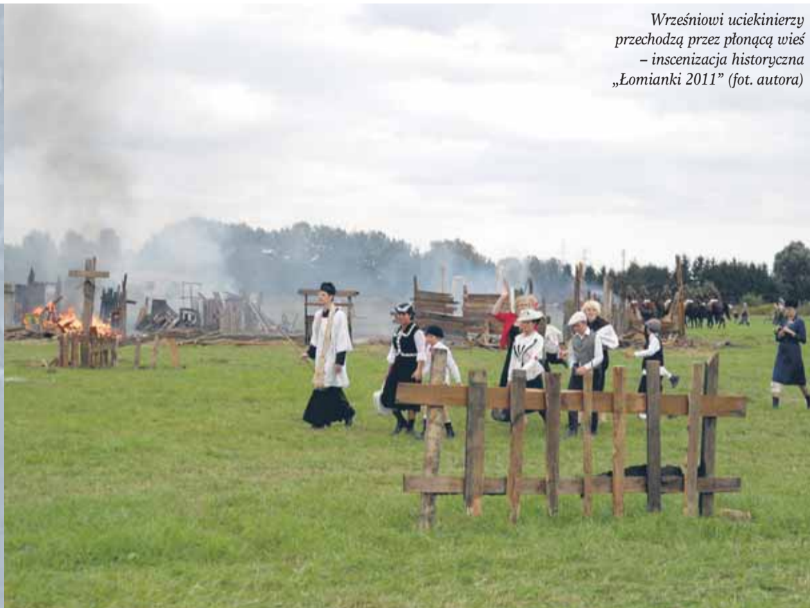
Wrześniowi uciekinierzy przechodzą przez płonącą wieś – inscenizacja historyczna „Łomianki 2011”