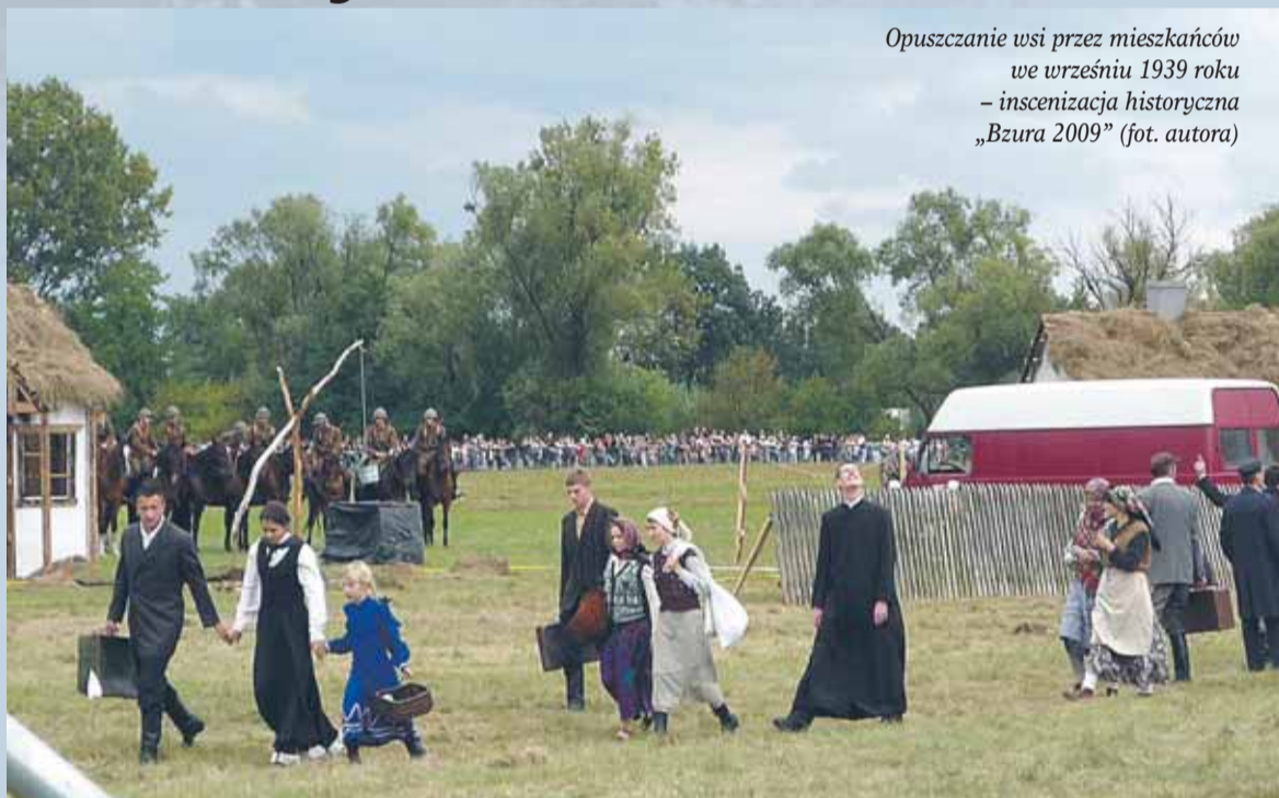
Opuszczanie wsi przez mieszkańców we wrześniu 1939 roku – inscenizacja historyczna „Bzura 2009”