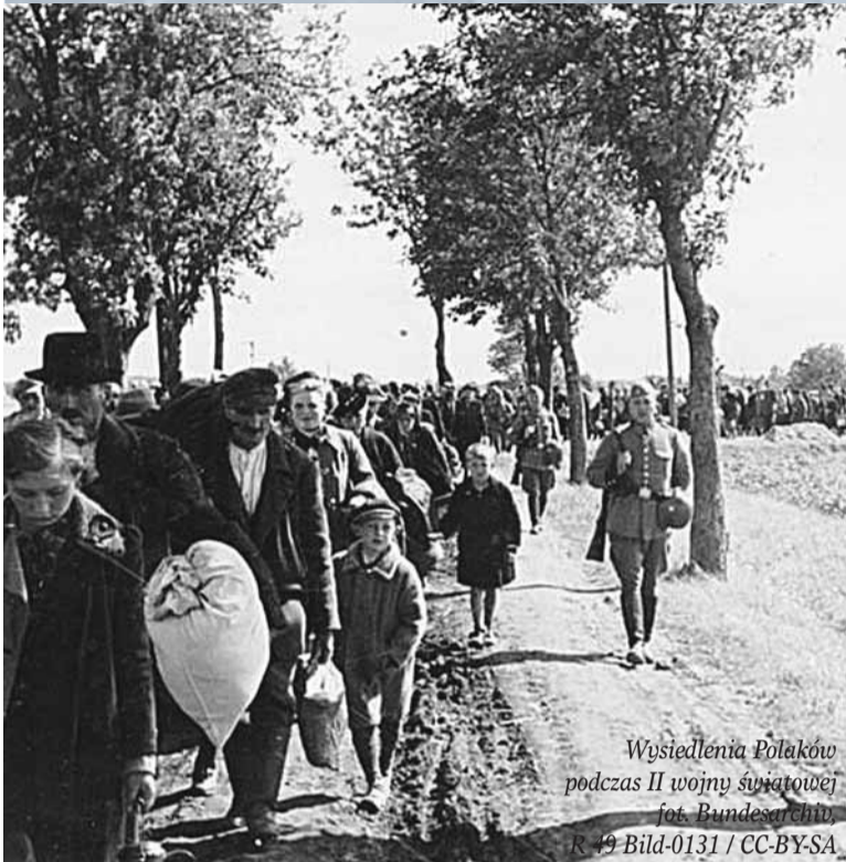
Wysiedlenia Polaków podczas II wojny światowej